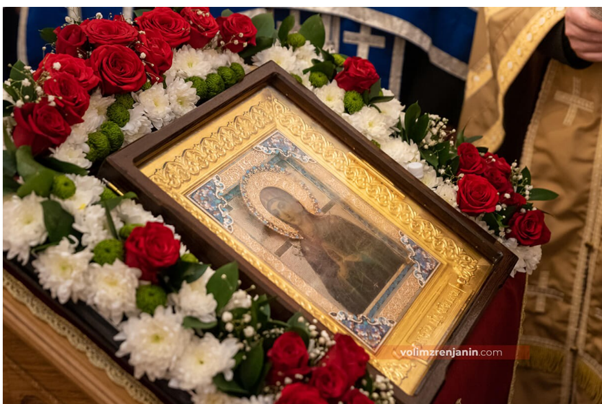
Икона Пресвете Богородице „Умекшање злих срца”

Божија благодат у овој Светој тајни лечи тело од његове немоћи и чисти душу од њених грехова. Ова Света тајна се врши у Цркви од Христовог времена. По заповести Хри-